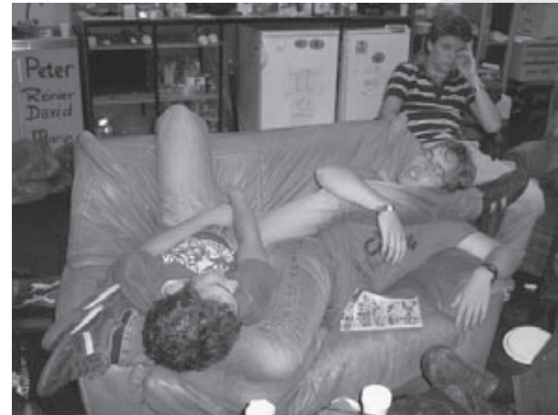
Zoals je ziet is de intro vrij vermoeiend.

Vrijdag werd er afgesloten met een "cantus". Nu ja, een "Nederlandse cantus" dan toch (het is geen echte cantus). Ondanks mijn Vlaamse hart was deze "cantus" met vooral bier gooien en te weinig bier drinken toch een meer dan waardige afsluiter van een fantastische introweek. Vrijdagmiddag was het dan ook tijd om een boel slaap in te halen. Intro 2007 was een week om nooit meer te vergeten.