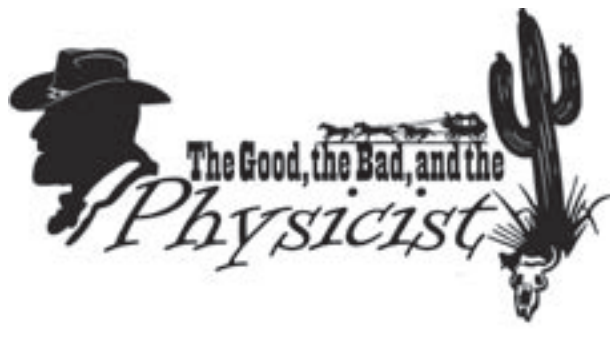
Introkoerier, jaargang 49

Hopelijk zien we je terug op 5, 6 en 7 september!