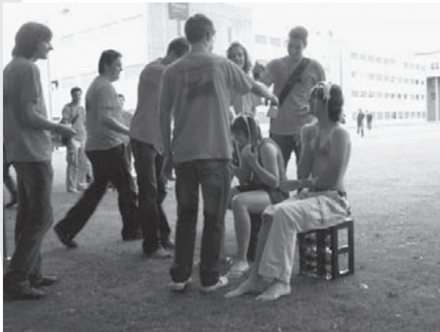
Een van de eerste spelletjes, maak je intro-begeleiders vies.

S'avonds begon het echte introleven, met z'n allen naar stratum voor het enige echte intro n-feest, super vet!. De rest van de week vloog voorbij, iedere dag waren er wel enkele leuke activiteiten, maar belangrijker nog, iedere avond stond er wel een gaaf feest op het programma.