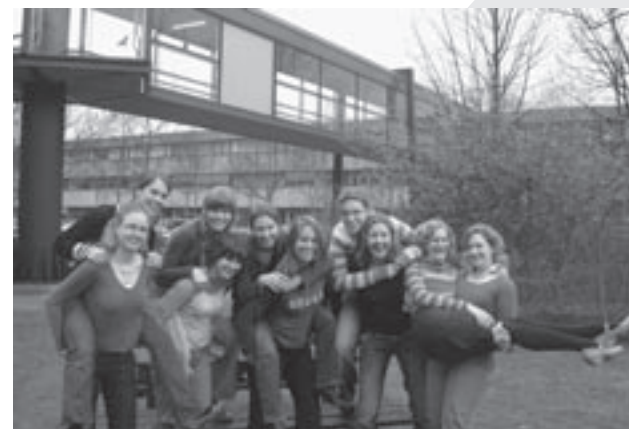
De tien eerste leden van ons dispuut.

manier, maar wel een hele leuke. En natuurlijk kletsten we de avond gemakkelijk vol. Meestal gaan we daarna met de mensen die daar zin in hebben naar Stratumseind. Daarnaast gaan we bijvoorbeeld ook met zijn allen naar de film.