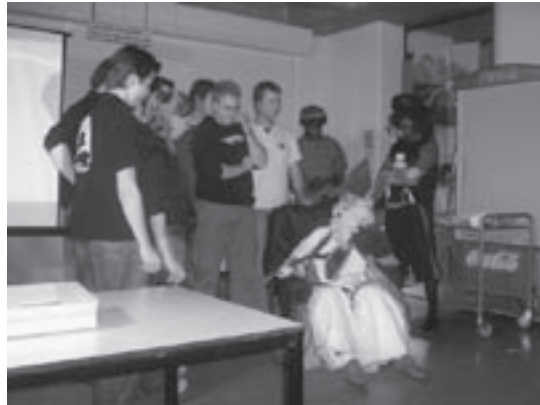
Sinterwaals bezoekt ons ieder jaar.

Eindhoven is ten opzichte van andere steden een stad met een vreemd verenigingsleven. In de meeste studentensteden is het zo dat er studieverenigingen zijn voor de studiegerelateerde zaken en studentenverenigingen voor de gezelligheid. Je ziet dat ik duidelijk onderscheid maak tussen het woord studieverenigingenstudentenvereniging; een studievereniging is namelijk een