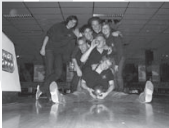
Het bestuur op het jaarlijkse bowlingtoernooi.

De naam ‘Van der Waals’ komt je waarschijnlijk bekend voor; Johannes Diderik Van der Waals is namelijk een natuurkundige Nobelprijswinnaar die leefde tussen 1837 en 1923. Hij is de persoon heeft ontdekt