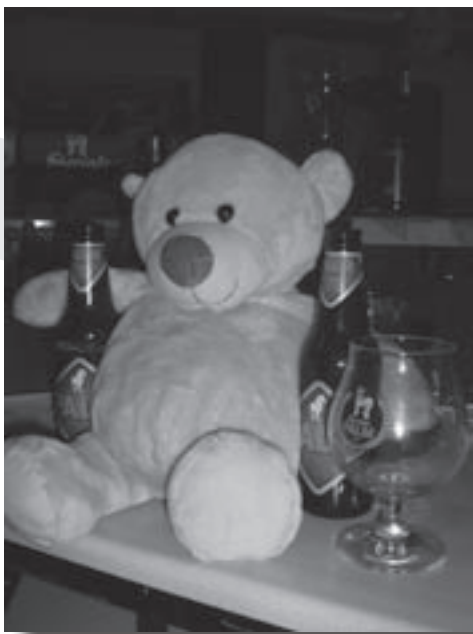
De EDDY-beer met de door EDDY zo geliefde Palm

Naast dit elitair onschuldig gedrag bezat Chaos een tweede weinig hoopvolle eigenschap. Ondanks dat Chaos zichzelf een Bourgondisch dispuut noemde, heeft het toch echter al tweemaal lichtelijk gefaald bij de jaarlijks terugkerende georganiseerde picknick. In 2005 was daar eerst het Afrikaans picknickfeest waar tientallen