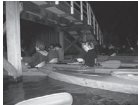
De door het bestuur georganiseerde kanotocht.

dat de ideale gaswet niet altijd geldt en kwam toen op de proppen met de Van-der-Waalsvergelijking. Het is daarom ook geen rare keuze om onze vereniging naar deze grootheid te vernoemen. Het woord Van-der-Waalskrachten zal jullie ook niet geheel onbekend voorkomen, deze heeft Van der Waals namelijk ook ontdekt. Het is ook de binding tussen onze leden waarvoor wij bekend staan in Eindhoven.