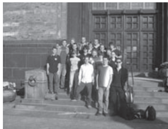
De Kleine BuEx ging dit jaar naar Kopenhagen.

voor de nodige ontspanning. Naast excursies naar bedrijven, waar je in de toekomst misschien gaat werken, zijn er interessante lezingen. Elk jaar is er een buitenlandse excursie (BuEx) van drie weken. Tijdens deze reis naar bijvoorbeeld Japan leer je de cultuur en wetenschap, maar ook de kroegen en cafés in het buitenland kennen. En als laatste, maar zeker niet minste voorbeeld is er elke donderdag een Borrel, waar je één of meer van de vele speciaalbieren kunt proberen!