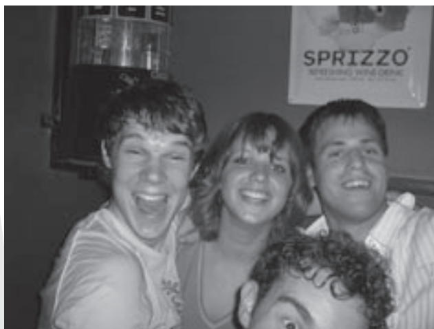
Gekke eerstejaars met links de bescheiden schrijver van dit prachtige verslag.