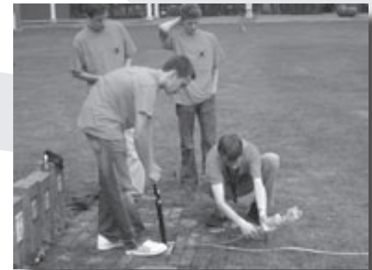
Zelfs de hersenen worden gepijnigd tijdens de Intro.

De volgende dag moesten we er weer vroeg uit: tijd voor ontbijt en een tochtje langs de instanties van de TU/e. We genoten tussen de middag van een lunch op de sportmarkt en gingen die middag op verkenning in het faculteitsgebouw van natuurkunde: N-laag. Hier werden we door middel van wat spelletjes en creatieve verwijzingen naar alle hoeken van N-laag gestuurd om zo het gebouw