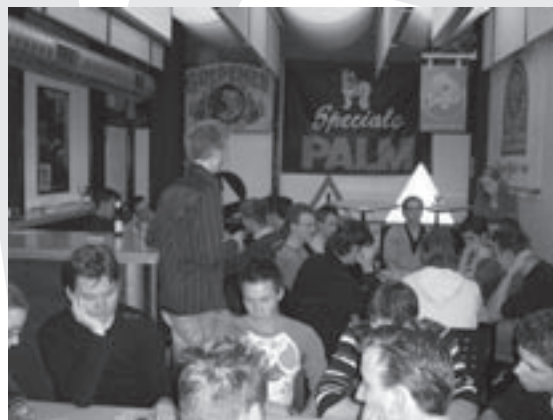
Het jaarlijkse pokertoernooi.

De Studievereniging Voor Technische Natuurkunde “J.D. van der Waals” is jouw vereniging. Met 390 leden, waarvan zo’n 150 actief, is het een grote en levendige vereniging. Je kunt hier voor van alles terecht. Zo kun je je studieboeken in de Van-der-Waalskamer kopen, waarmee je de kosten van het lidmaatschap al weer terugverdiend hebt. Er worden N-feesten, sporttoernooien, weekends en een dropping georganiseerd,