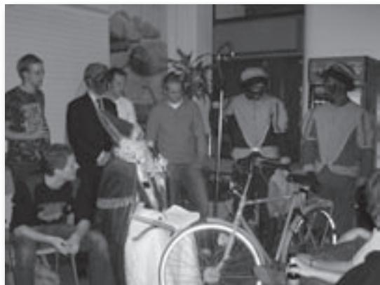
Sinterwaals bezoekt ons ieder jaar.

Niet in de laatste plaats zijn daar de studieverenigingen. Studieverenigingen heten zo omdat ze gekoppeld zijn aan één of meer studies. Bij deze