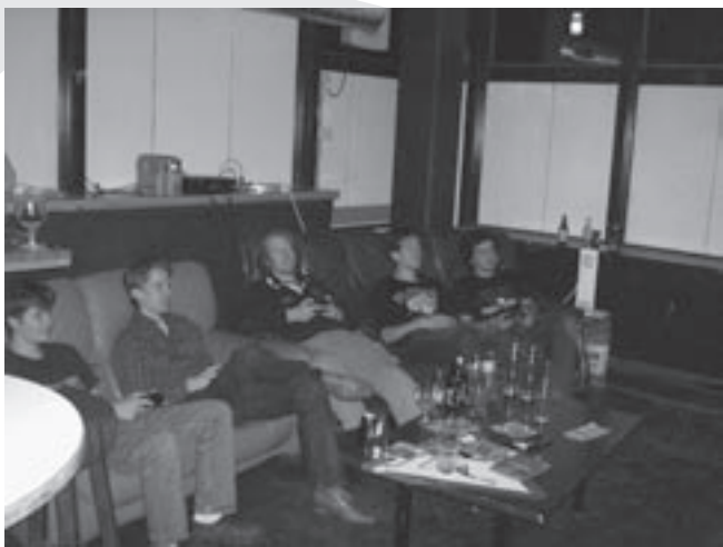
Delen van DVD tijdens de NintendoNight.

Deze nobele doelstelling is tot stand gekomen uit de filosofie van de weledele oprichters dat men met een studie Technische Natuurkunde (of Elektrotechniek) al genoeg kansen creëerde voor het latere leven, en