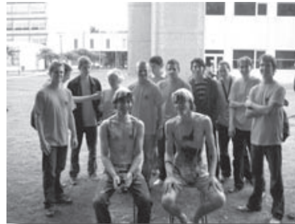
De intro-ouders versieren tijdens Op slag van Maandag

Dat de Intro zo'n diepe indruk op mij heeft gemaakt, heeft alles te maken met de invulling van de week. Doordat je met een aantal lotgenoten vanaf de eerste dag leuke, leerzame