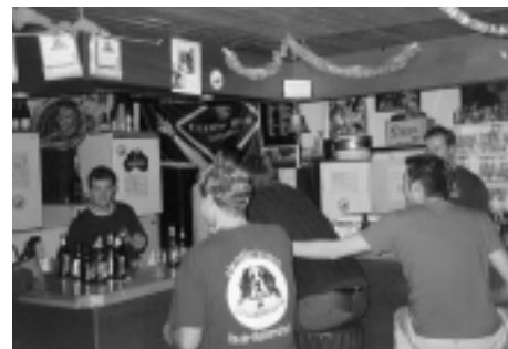
Een van de wekelijkse Borrels in de 'Salon'

Elke donderdagmiddag is er dan natuurlijk nog de Borrel, waar zowel studenten als medewerkers van de faculteit Natuurkunde alvast het einde van de week vieren onder het genot van een biertje. Dit is natuurlijk een goede gelegenheid om eens informeel te spreken met je docenten. Natuurlijk is deze vereniging voor studenten,