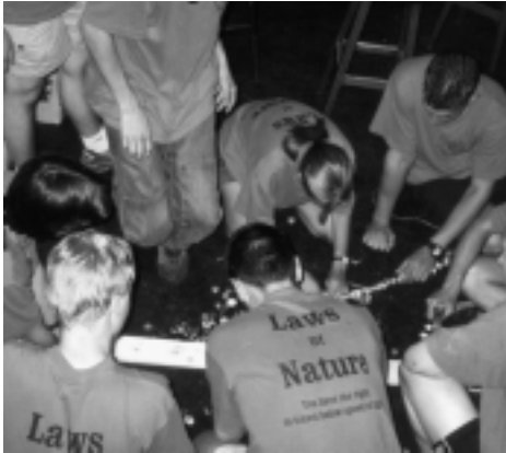
Traditioneel bierdopjes rijgen in de 'Salon', de ruimte waarin de Borrel wordt gehouden

in Hemelrijken tot onze beschikking, waar we ons konden voorbereiden op de kroegtocht die die avond op het programma stond. Na zes kroegen met zes gratis consumpties langsgedaan te zijn leverde deze tocht een gratis gevulde plastic pul op.