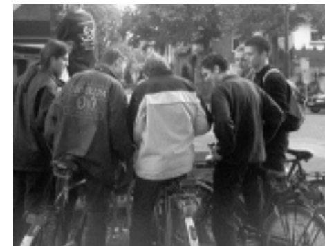
Groepsoverleg tijdens de fietstocht op zaterdagochtend

gekomen, maar volgens mij lag het merendeel op dat moment z'n roes al uit te slapen.