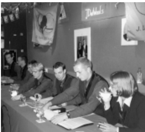
Het bestuur van Van der Waals tijdens een Algemene Ledenvergadering

S tudievereniging voor Technische Natuurkunde "Johannes Diderik van der Waals" is de studievereniging voor studenten Technische Natuurkunde aan de Technische Universiteit Eindhoven. De vereniging telt zo'n 300 leden, allen student, waarvan bijna de helft ook actief betrokken is bij de vereniging met het organiseren van activiteiten. De vereniging stelt zichzelf ten doel om studenten enthousiast te maken en te houden voor de studie die ze volgen en bovendien de onderlinge contacten tussen de studenten te verbeteren.