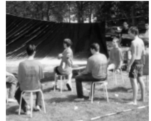
Volleyballen met waterzakjes, op krukken en over een vrij ondoorzichtig net