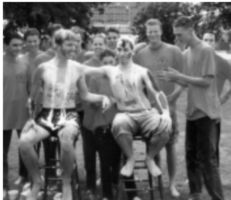
Een introgroepje met begeleiders tijdens 'Op slag van Maandag'