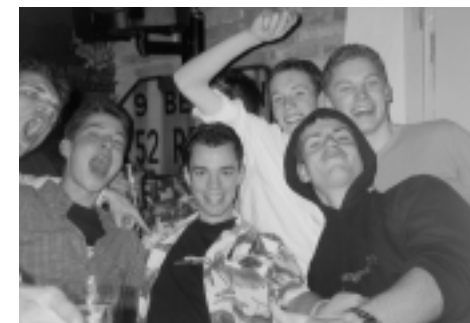
Eerstejaars tijdens het drie maal per jaar georganiseerde N-feest

Waarom zou je als student in zo'n commissie gaan? In de eerste plaats is het natuurlijk hartstikke leuk om voor je verenigingsgenoten