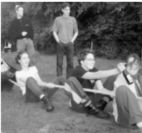
Het spel van dispuut Scooter tijdens de dispuutenmiddag op zaterdag

moeten voorstellen?). Op dat moment barstte Chaos los en ging samen met Daedalus een vla-anval voorbereiden op het (op dit moment) voormalige bestuur. Vooral door deze gevechten en het everzwijnspeel waren de meesten supersmerig.